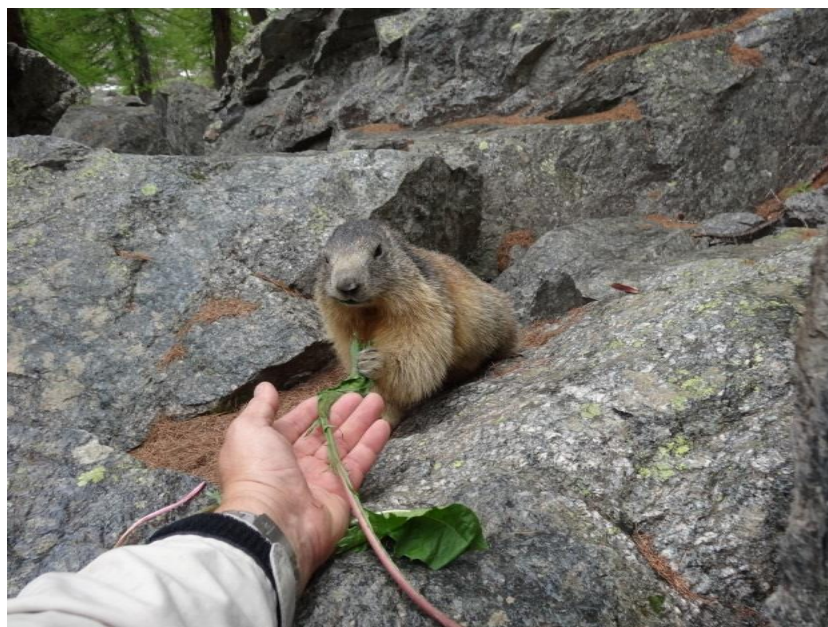
3) Bon appétit madame la marmotte

Deux chamois gambadent sur le névé en rive droite. Nous allons voir, nos amies les marmottes de « Madame Carle ». En nous approchant délicatement, elles ne fuient pas et nous pouvons les mitrailler afin de les prendre en photo avec le groupe derrière je contourne le rocher en passant près du refuge. Un des gardiens me donne une poignée de pissenlit en déclarant que si je suis assez patient, elles viendront me manger dans la main... Je me rapproche doucement et lorsque qu'elles se lèvent pour fuir, je leur montre mon bouquet de feuilles, aussitôt une d'entre elles semble intéressées. Très craintive, elle s'approche doucement, attrape