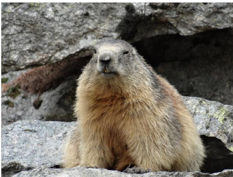
2) Dame marmotte vue de face