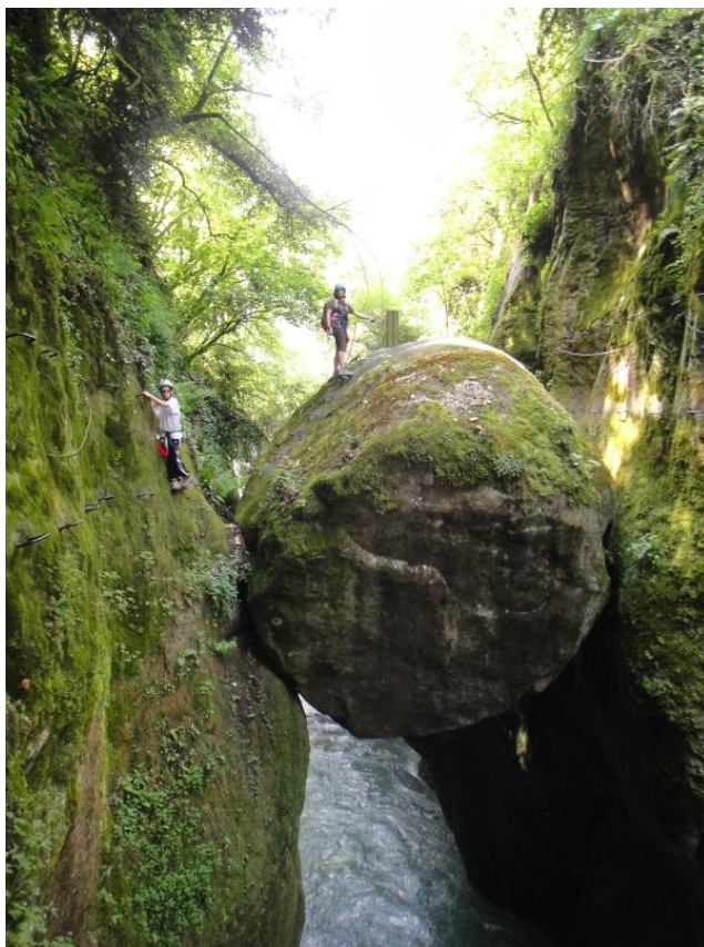
Le gros bloc coincé dans les gorges de la Vésubie

L'idée de programmer cette sortie m'est venue grâce à un précédent WE à Auron et Lantosque où la pluie nous avait contraint d'abandonner le via d'Auron au 5ème tronçon sur les 7 existants... De plus, il y avait un excellent camping municipal à St Etienne de Tinée avec un tarif avantageux pour les groupes... Mais ce camping, comme la plus part dans la région, est encore fermé et pour bivouaquer, Auron, ce n'est pas top, c'est mieux la Colmiane tout en étant beaucoup moins loin, premier changement. Dès lundi dernier, la météo annonce du mauvais temps, mais je commence à connaître la région et la météo locale capricieuse. Vendredi matin vers 7 heures, je change de destination pour les Alpes, où il est censé faire beau, en prévoyant le bivouac à Freissinière. Puis la météo de 9h15 change totalement et annonce des orages dans le 05, celle de Nice ne prévoit des orages que l'après-midi, ce qui ne nous gênera pas pour les via mais peut-être pour le bivouac. Je choisis donc pour samedi, les Gorges de la Vésubie (Lantosque) qui est assez bien protégé de la foudre et pour dimanche, Les Demoiselles de Castagnet (Puget Theniers) afin de pouvoir bivouaquer au sec à la cabane du Pali en cas de pluie. Vendredi Soir, 3 adhérentes inscrites, préfèrent déclarer forfait par crainte de la pluie, je leur dit qu'elles ont tort, je suis quasiment sûr que nous aurons des belles journées, sinon j'aurai annulé, mais cela ne suffit pas à les convaincre.