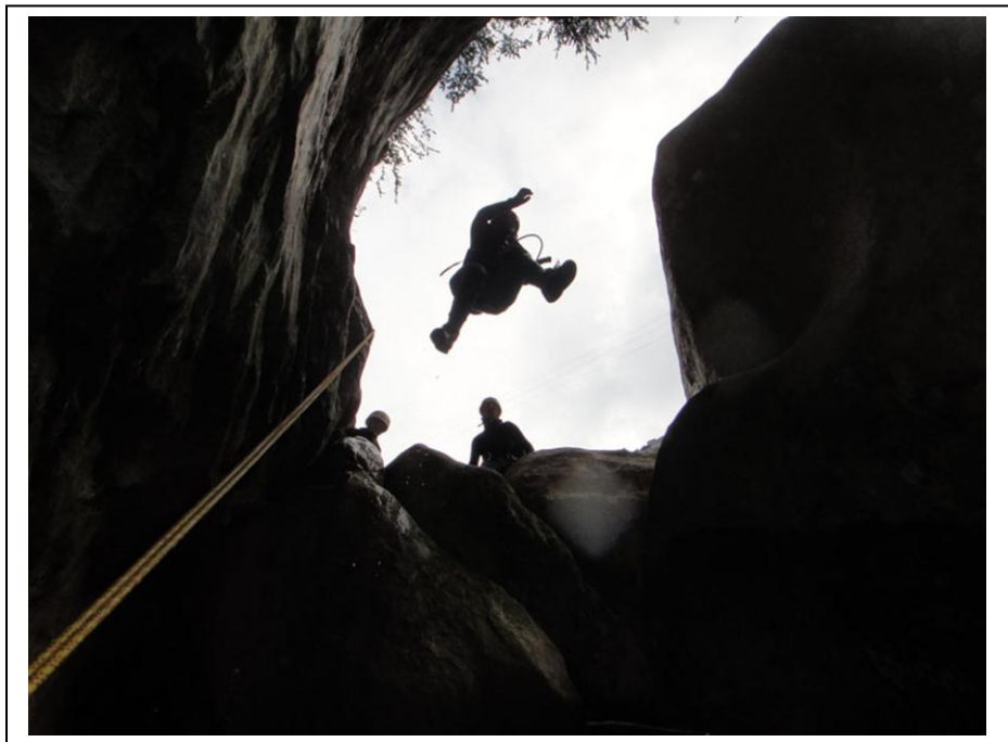
Un des premiers sauts du Riolan